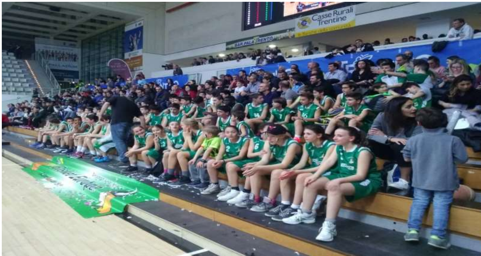
PalaTrento invitati da Aquila Basket Trento partita di A1 maschile -